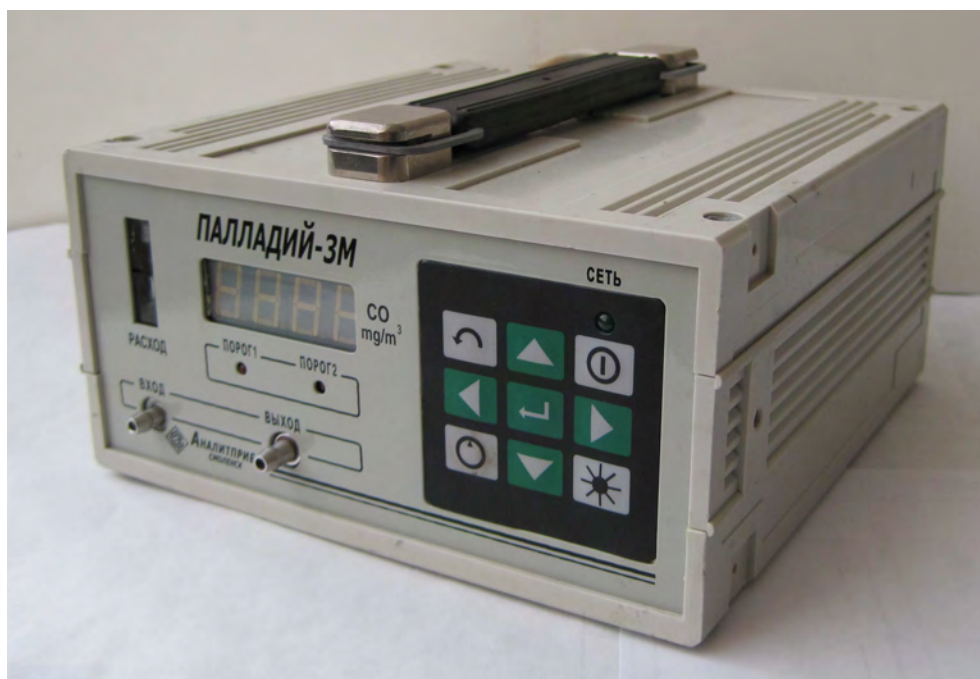
Рисунок 1 - Внешний вид газоанализаторов

Внешний вид газоанализаторов показан на рисунке 1.