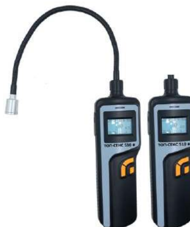
е) модификация ТОП-СЕНС 510