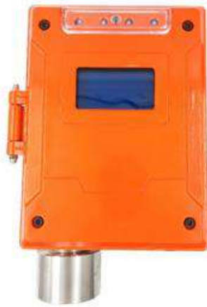
и) модификация ТОП-СЕНС 1000