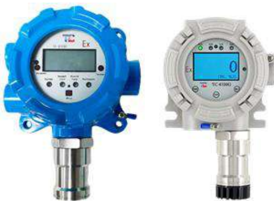
л) модификация ТОП-СЕНС 4100 G