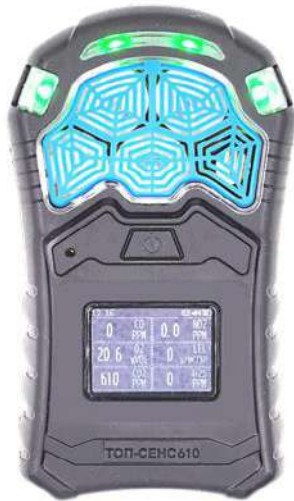
ж) модификация ТОП-СЕНС 610