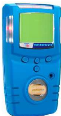
а) модификация ТОП-СЕНС 210

Общий вид газоанализаторов представлен на рисунке 1.