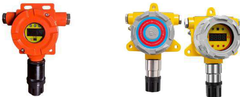
н) модификация ТОП-СЕНС 10 N