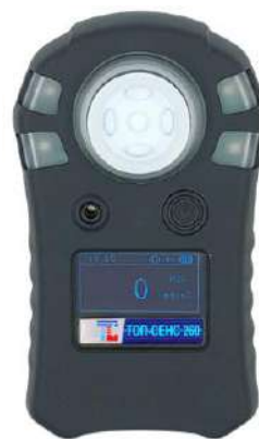
б) модификация ТОП-СЕНС 260