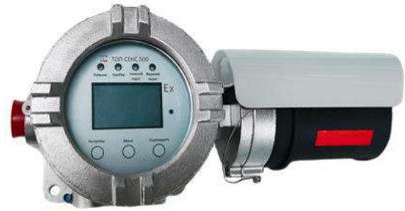
з) модификация ТОП-СЕНС 500