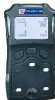
г) модификация ТОП-СЕНС 360