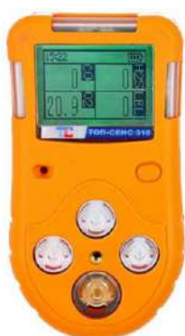
в) модификация ТОП-СЕНС 310