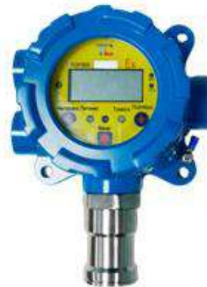
м) модификации ТОП-СЕНС 4100 S