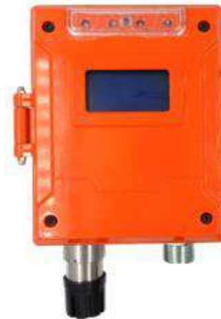
к) модификация ТОП-СЕНС F