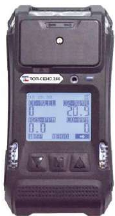
д) модификация ТОП-СЕНС 380